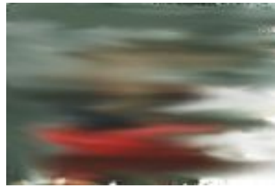
Lialli aetud pilt